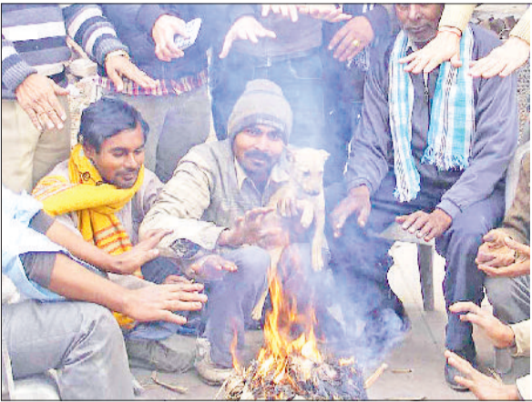
यमुनानगर। बुधवार को कड़ाके की ठंड में अलाव तापते कामकाजी लोग व आसमान में छाए घने कोहरे में सड़कों पर लाइटें जलाकर अपने गंतव्य पर जाते लोग।

अलाव जलाकर व घरों में दुबक कर लोगों ने ठंड से राहत पाने का किया प्रयास