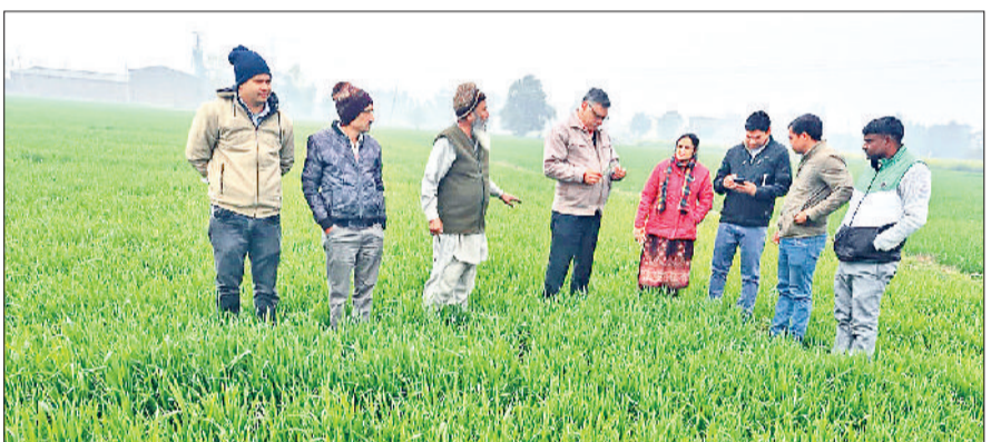
अंबाला। फसल में येलो रस्ट की जांच करते कृषि अधिकारी।

गांव मिल्क धनकोटा, मनका, बिकमपुर व ब्लॉक साहा के गांव तेपला, जिला पंचकूला के खंड रायपुरानी के गांव, हंगोला, प्यारेवाला व गड़ी कोटाहा का सर्वेक्षण किया