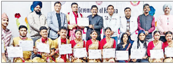
पानीपत। राष्ट्रीय एकता शिविर में अतिथियों के साथ स्वयंसेवी विद्यार्थी।

गुरु गोबिंद सिंह पब्लिक स्कूल पानीपत में आयोजित किया गया एनएसएस का शिविर