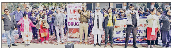
पानीपत। राजकीय स्कूल में नशे के विरुद्ध शपथ लेते हुए शिक्षक व विद्यार्थी।

पानीपत जिला पुलिस द्वारा नशे के खिलाफ जागरूकता अभियान चलाया जा रहा है। इसी कड़ी में पुलिस की नशा मुक्त टीम ने विभिन्न गांवों के राजकीय स्कूलों में जागरूकता कार्यक्रम आयोजित कर विद्यार्थियों को नशे के दुष्परिणामों की जानकारी देकर नशे के खिलाफ प्रेरित किया। वहीं पुलिस टीम द्वारा इस दौरान नशे के दुष्परिणामों और इससे होने वाले शारीरिक, मानसिक, आर्थिक और सामाजिक